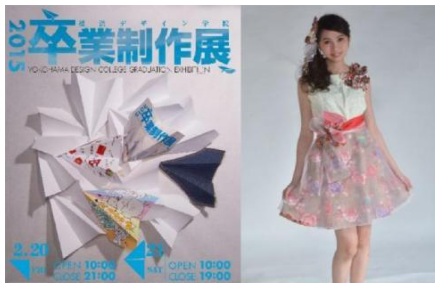
Выставка выпускных работ